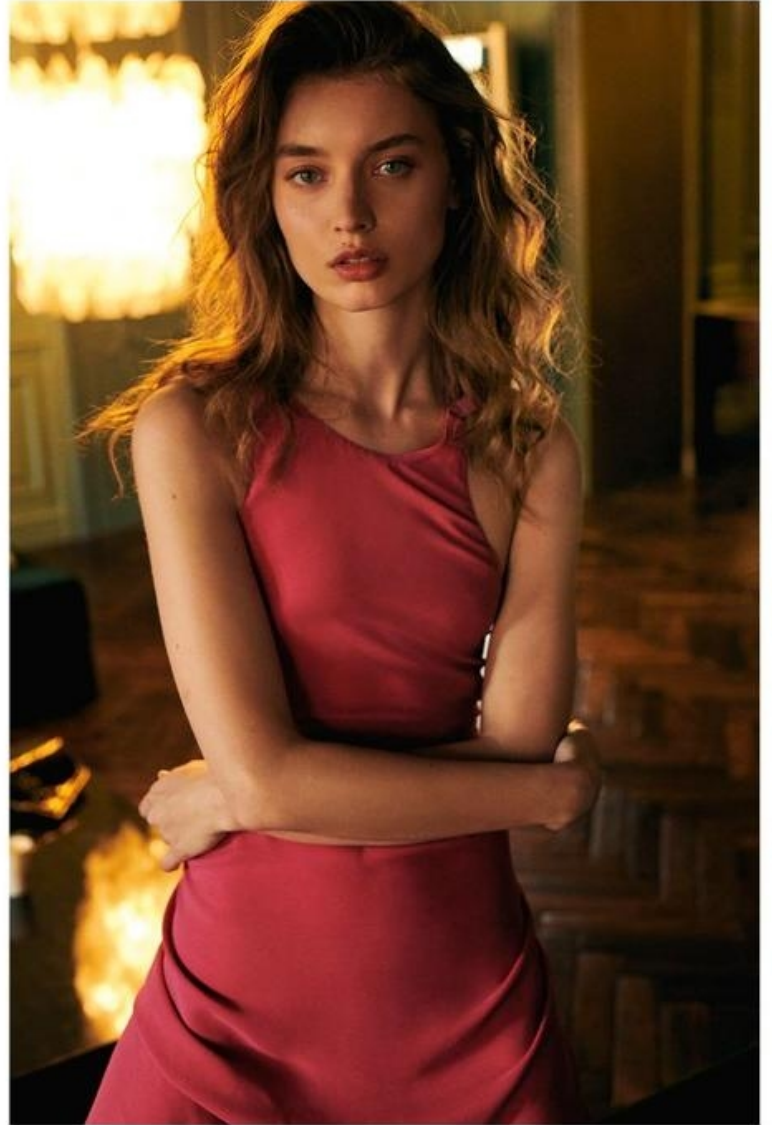
Elbise Fendi YAN SAYFADA: Elbise, sandaletler ve küpeler Fendi