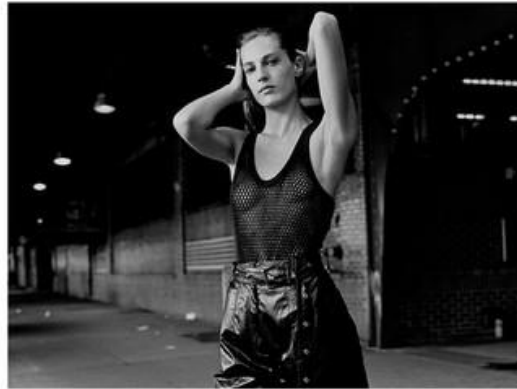
Look 1 by P. Follis Shoes by Christian Louboutin