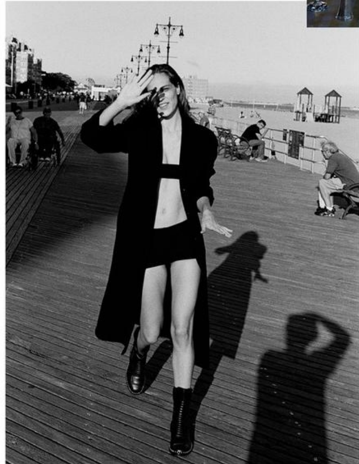
Look 2 Dress by Alexander Wang Shoes by Versace Look 3 Dress by Alexander Wang Shoes by Alexander Wang