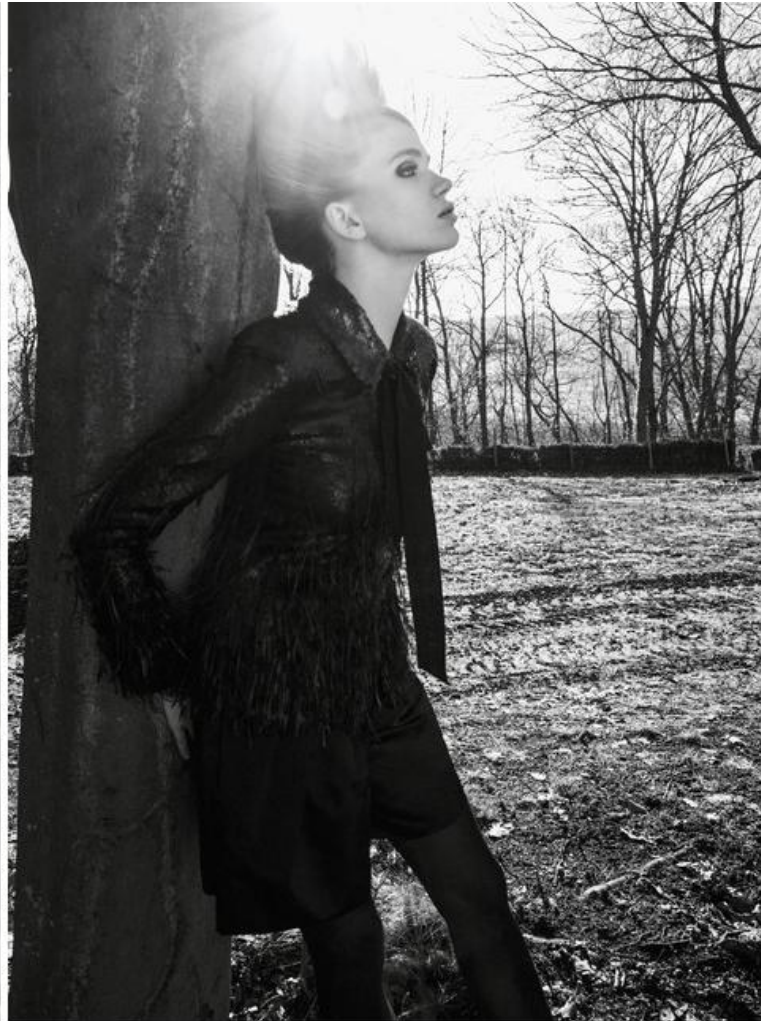
Σύνολο από πελά από σπεν, με μαγιότς και αντλιάς φερτί οργουόσκαπύοο, σοκ jupe culotte από satín duchesse, Όλα Chanel , Lince Piu .