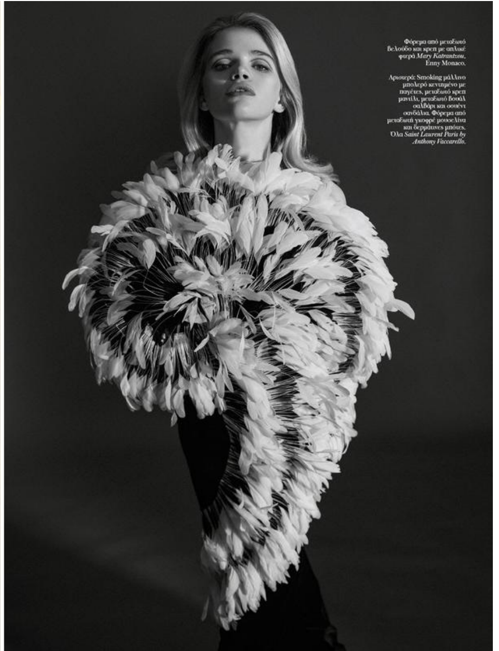
Φόρεμα από μεταξωτό βελούδο και σπεντ με αντανά- φιστό Mary Katrantzou, Enny Monaco.