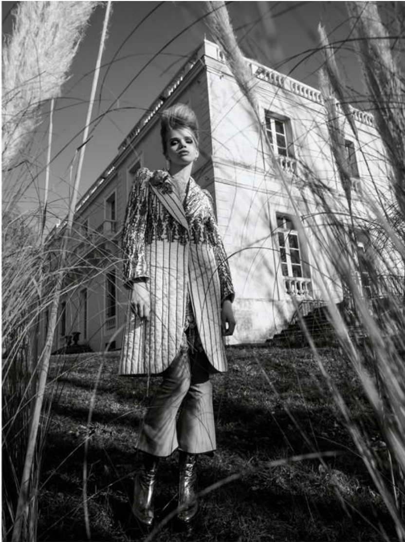
Βαμβαρό μαντί, δανιέζια τσάντα, πολεόουρ πολεόουρ και μπλουζάκι από Βενόλ, Όλα Louis Fuitton Boutique , Μπόουρ, Dries Van Noten .