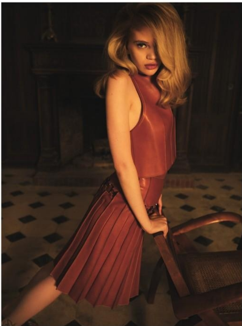
Διπλότυπο deux pièces, Hermès Boutique.