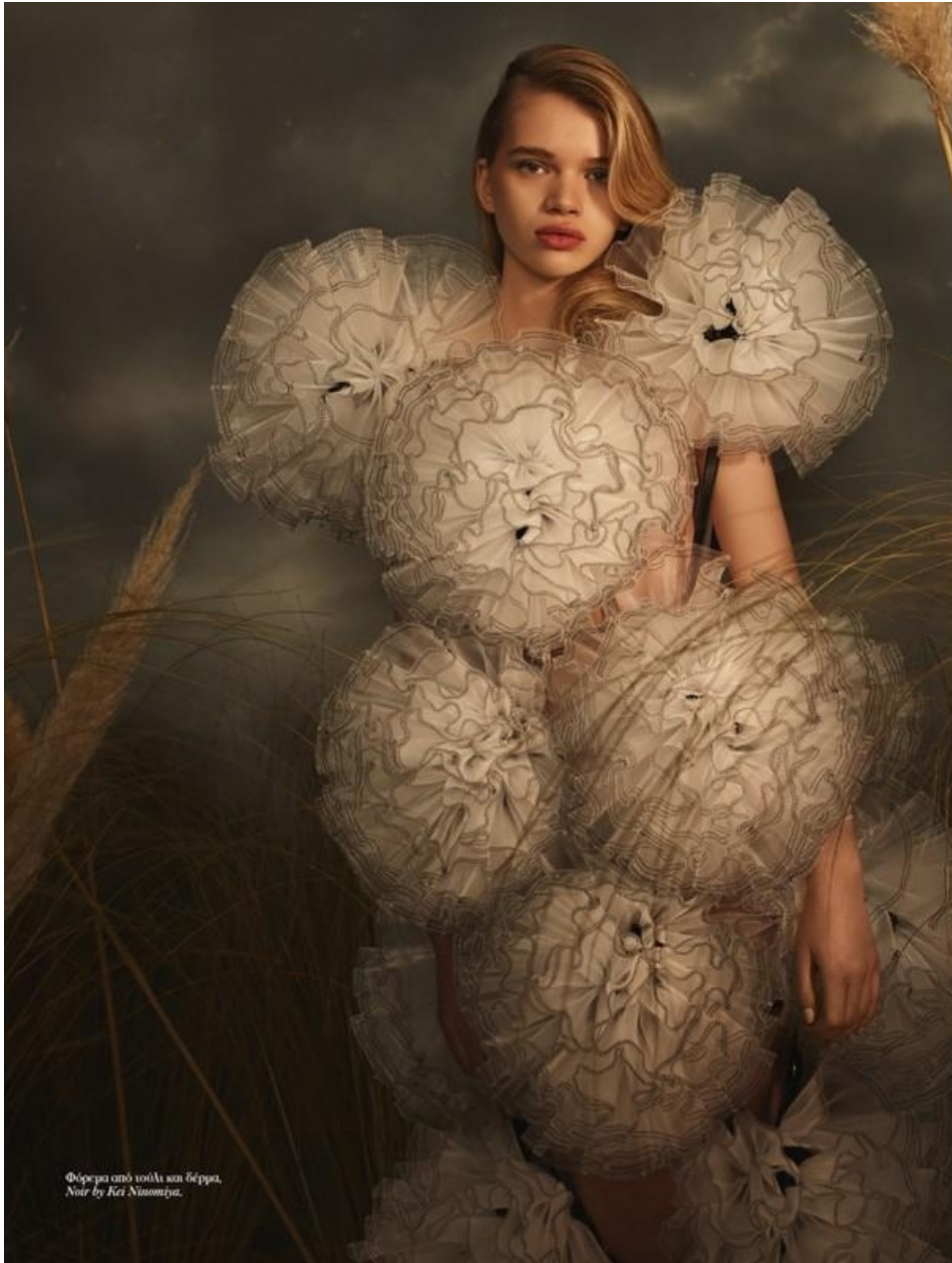
Φόρεμα από 100%λν και δέρμα, Noir by Kiki Ntamosira.